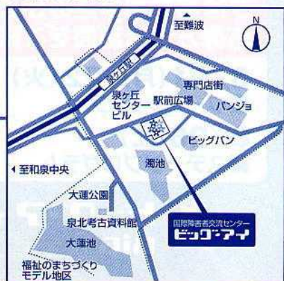
■難波から準急で約30分(南海電車・泉北高速鉄道利用)

●電話でのお問い合わせは、土・日・祝を除く9:30~18:00とさせていただきます。●8月26日(土)については、駐車場は障害者の方専用(但し、駐車証を発行した方のみ)となりますので、公共交通機関をご利用ください。●ご応募いただいた個人情報については個人情報保護法関係法令等を遵守し、「バリアフリーアートアカデミー サマーフェスタ2006」に関するご連絡及びデータ分析以外の目的では使用いたしません。