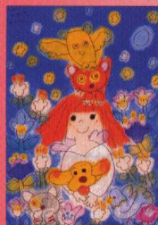
「蒸籠な夜」©エム ナマエ