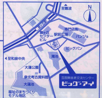
■難波から徒歩で約30分(南海電車・東北高速鉄道利用)

●電話でのお問い合わせは、土・日・祝を除く9:30~18:00とさせていただきます。●2月4日(日)については、駐車場は障害者の方専用(但し、駐車証を発行した方のみ)となりますので、公共交通機関をご利用ください。●ご応募いただいた個人情報については個人情報保護法関係法令等を遵守し、「バリアフリーアートアカデミー ハートフルフェスタ2007」に関するご連絡及びデータ分析以外の目的では使用いたしません。