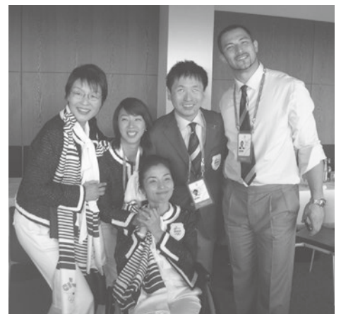
2016年東京オリパラ招致活動に参加

大阪市生まれ。客船「飛鳥」のパイサーとして乗務中、脊髄の血管の病気のため車いす生活となる。退院後、友人の誘いでビームライフル(光線銃)射撃を始め、その後実弾を使用するライフル射撃に転向。アテネ(7位)、北京(8位)、ロンドンの3大会連続でパラリンピックに出場。東京2020オリンピックパラリンピック競技大会では、聖火リレー公式アンバサダー、選手村副村長としても大会を盛り上げた。日本パラリンピック委員会運営委員、日本オリンピック委員会理事も務める。